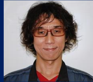
三重認 SA000004 号 H17.9.1~R07.9.1(更新3) 有限会社後藤自動車整備 後藤 和広