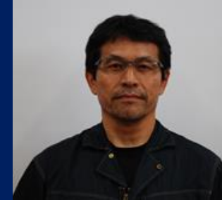
三重認 C000017 号 H20.9.1～R10.9.1(更新3) 太田自動車整備工場 太田 光俊