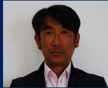
三重認 SA000002 号 H17.4.1~R12.4.1(更新4) 尾崎自動車 尾崎 満