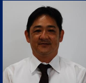
三重認 C000011 号 H19.9.1～R09.9.1(更新3) ホンダカーズ三重北 黒川 一