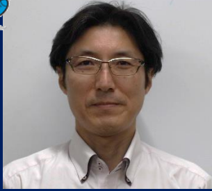
三重認 C000003 号 H17.9.1～R07.9.1(更新3) 日産プリンス三重販売株式会社 森 公一