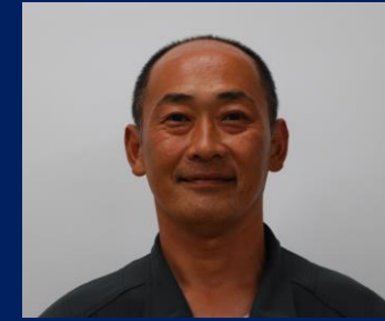
三重認 SA000008 号 H26.9.1~R11.9.1(更新2) 有限会社近江屋モータース 雲 真仁