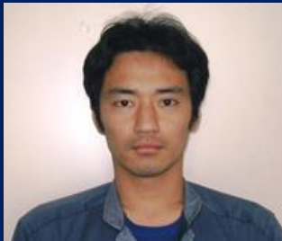
三重認 C000010 号 H18.9.1～R08.9.1(更新3) ホウワオートサービス 久保 浩和