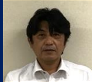
三重認 C000006 号 H18.9.1～R08.9.1(更新3) 株式会社ダイハツ三重 南部 和成