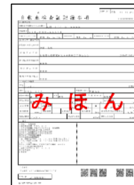
自動車検査証記録事項

車両を検査する自動車検査員が車検証閲覧アプリから印刷した自動車検査証記録事項による確認でも結構です。