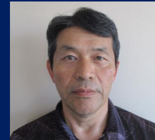
三重認 C000017 号 H20.9.1～R10.9.1(更新3) 太田自動車整備工場 太田 光俊