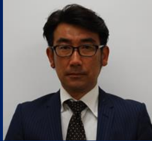
三重認 SA000002 号 H17.4.1~R07.4.1(更新3) 尾崎自動車 尾崎 満