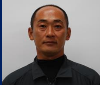
三重認 SA000008 号 H26.9.1~R06.9.1(更新1) 有限会社近江屋モータース 雲 真仁