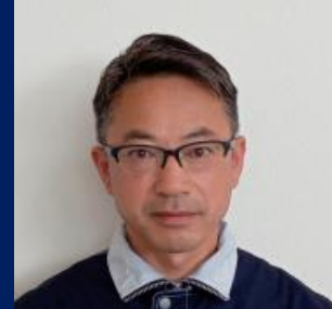
三重認 C000016 号 H20.9.1～R10.9.1(更新3) オートオアシスナガシマ 糸見 利行