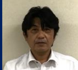
三重認 C000006 号 H18.9.1～R08.9.1(更新3) 株式会社ダイハツ三重 南部 和成