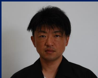
三重認 C000020 号 H24.9.1～R09.9.1(更新2) 日産プリンス三重販売株式会社 中山 潤一